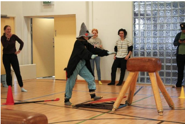
Ykkösten illanviettoa, syksy 2023.

Opiskelijakunta järjestää tapahtumia opiskelijoille ja osallistuu opintoretkien suunnitteluun ja toteutukseen. Opiskelijoiden ja opettajien välit ovat Ilomantsin lukiossa luonteet ja jokainen saa olla oma itsensä. Opiskelijat kehuvatkin hyvää ilmapiiriä kyselyissä vuosi toisensa jälkeen.