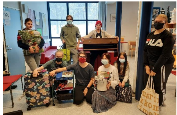
... kuin opiskelijoilla.