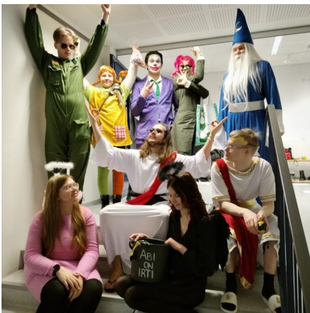
Penkkaripäivä keväällä 2023.

Myös pääsykokeet säilyvät väylänä opintoihin.