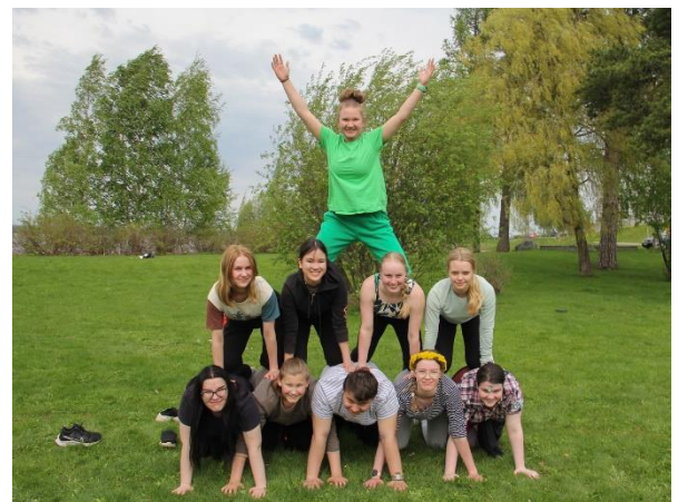
Kuva on ykkösten retkipäivästä keväältä 2023.