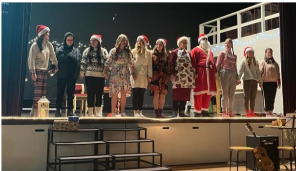
Joulujuhlaa 2022 viettämässä.

Meillä on tapana järjestää myös liikunnallista yhdessäoloa, vaikkapa mäenlaskua tai pallopelejä. Läksyjäkään ei tarvitse puurtaa yksin: pöydän ympärille vain opiskelurinki pystyy! Osaamistaan kannattaa jakaa.