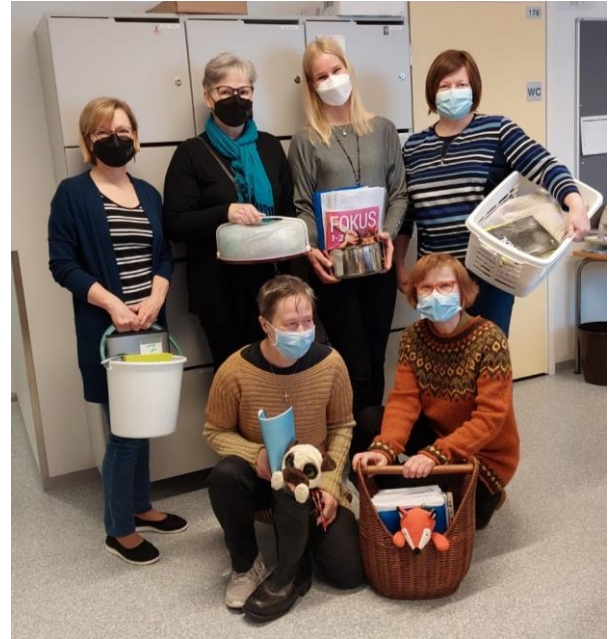
Keväällä 2022 oli reputon koulupäivä niin opettajilla ...