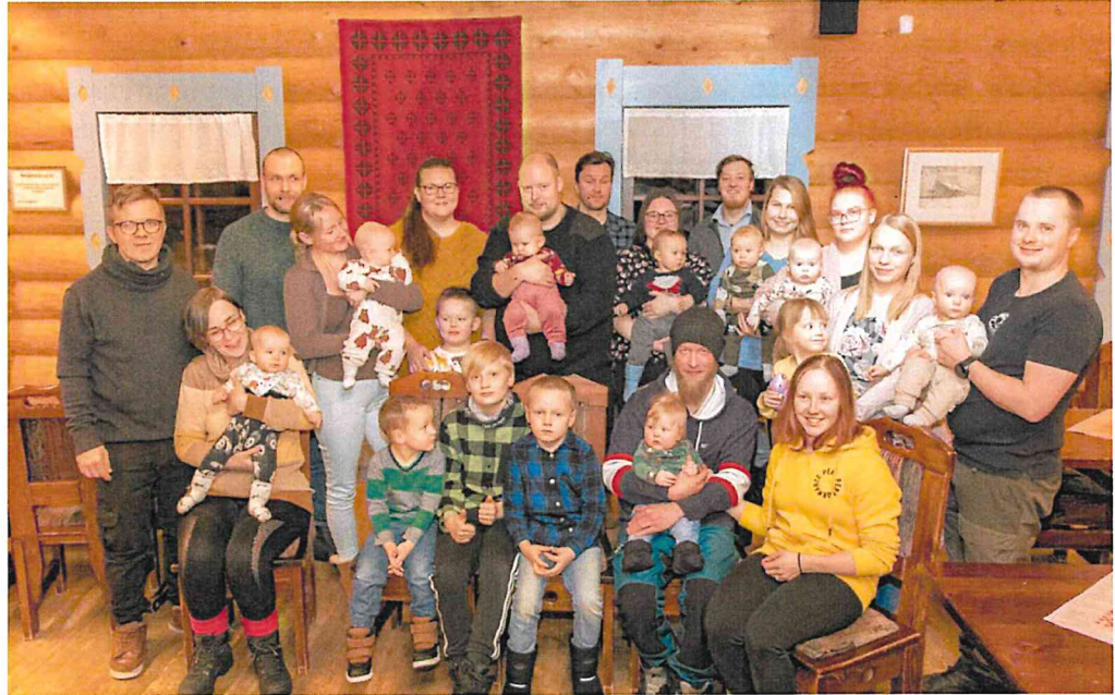
VAUVAJUHLA JA NÄITÄ TARVITAAN 1

Ilomantsi tarvitsee uusia asukkaita ja heidän mukanaan tuomaa elinvoimaa. Kilpailu lähikuntien kesken uusista asukkaista ja matkailijoista on kovaa ja entisestään kovenee. Kuva kertoo enemmän, kuin tuhat sanaa.