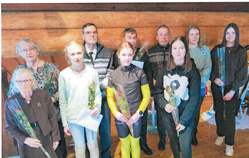
KALEVALAN JUHLAVUODEN PALKITUT 1

Kuusi vuotta sitten syyrialaiset pakolaiset saapuivat.