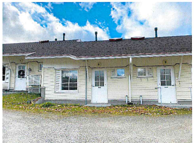
MYYNNISSÄ OLEVA OSAKEHUONEISTO 1

Vuoden 2023 talousarviokirjan mukaan investoinnit olisivat 648.000 euroa. Talousarviomuutosten 110.000 euroa myötä investoinnit olisivat olleet 538.000 euroa. Toteutuneiden investointimenojen yhteismäärä oli 311.921 euroa.